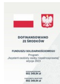
Program „Asystent osobisty osoby niepełnosprawnej” - edycja 2023